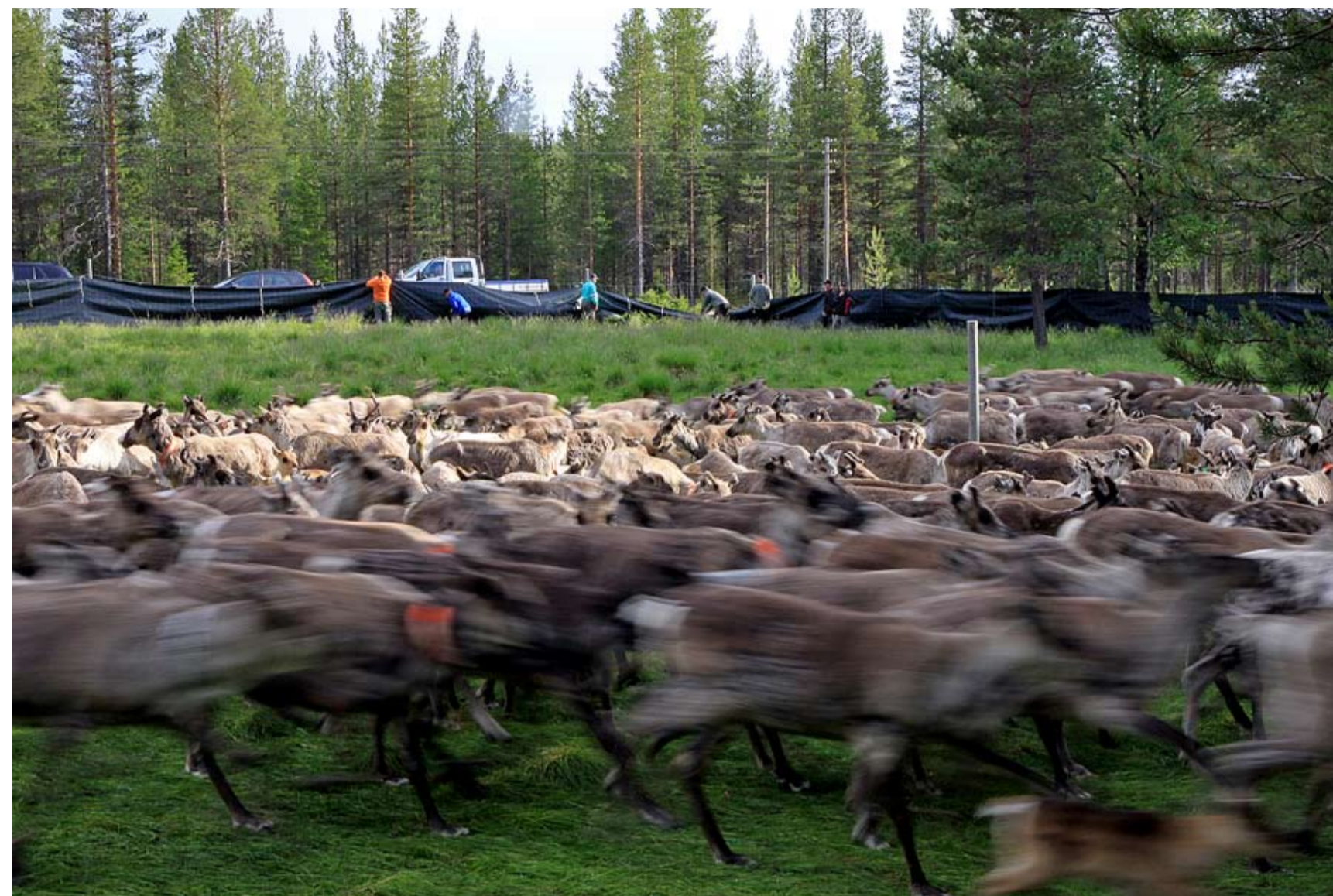
Efter insamlingen är renarna uppjagade och dundrar runt i en stor cirkel inne i inhägnaden.