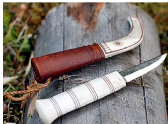
Kalvmärkningskniv. Bladet är specialanpassat för att kalven ska blöda så lite som möjligt.