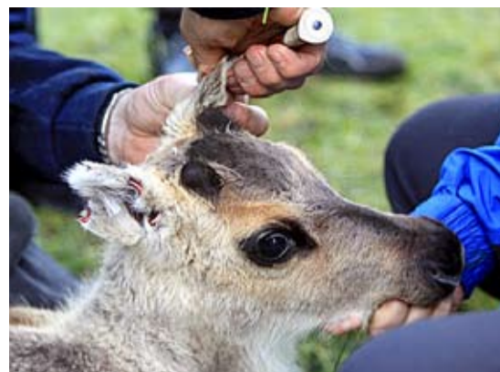
Kalven varken rycker till eller markerar smärta trots att den blir skuren i öronen.