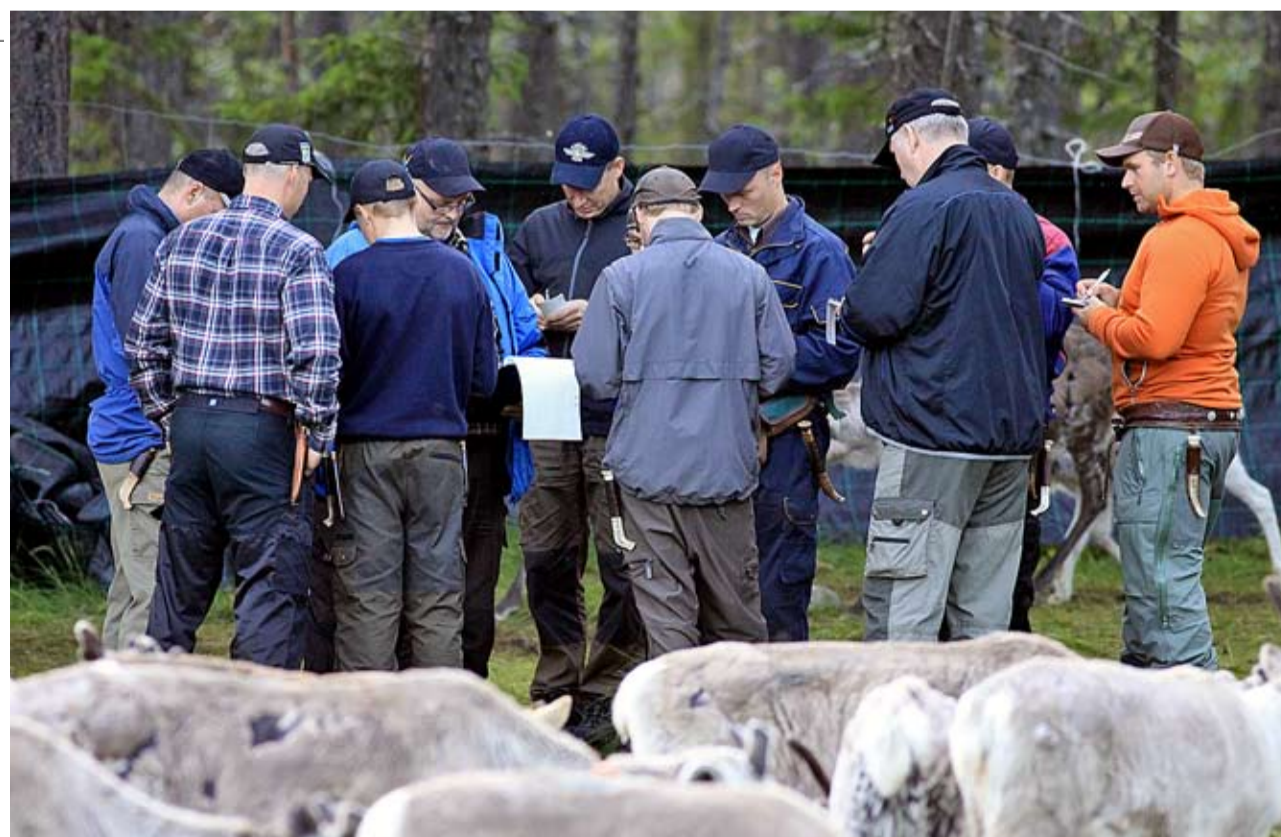
När kalvarna har försetts med en nummerbricka dokumenterar man vilken kalv som hör till vilken vaja. Först därefter kan kalvarna märkas.

Frågan som jag tidigare ställt mig blir nu åter aktuell: Hur i hela friden får man