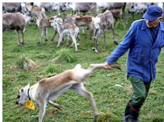
En äldre man har fångat en kalv i benet med bara händerna. Ibland lyckas det, ibland inte.