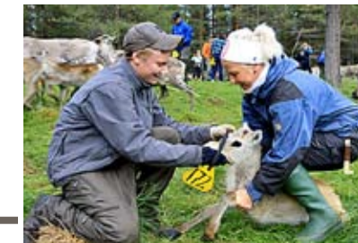
En sprallig kalv får brickan runt halsen.

ra renar väller över vägen som en stor brun lavaflod och det går fort, så fort att renskötarna får anstränga sig ordentligt för att styra den vilda flocken som tuffar fram som ett skenande lokomotiv. Nu uppenbarar sig återigen helikoptern som en bevingad hjälpare och på låg höjd driver den tillsammans med renskötarna på marken skickligt in renarna mot den fångstarm som öppnats i mot hagen.