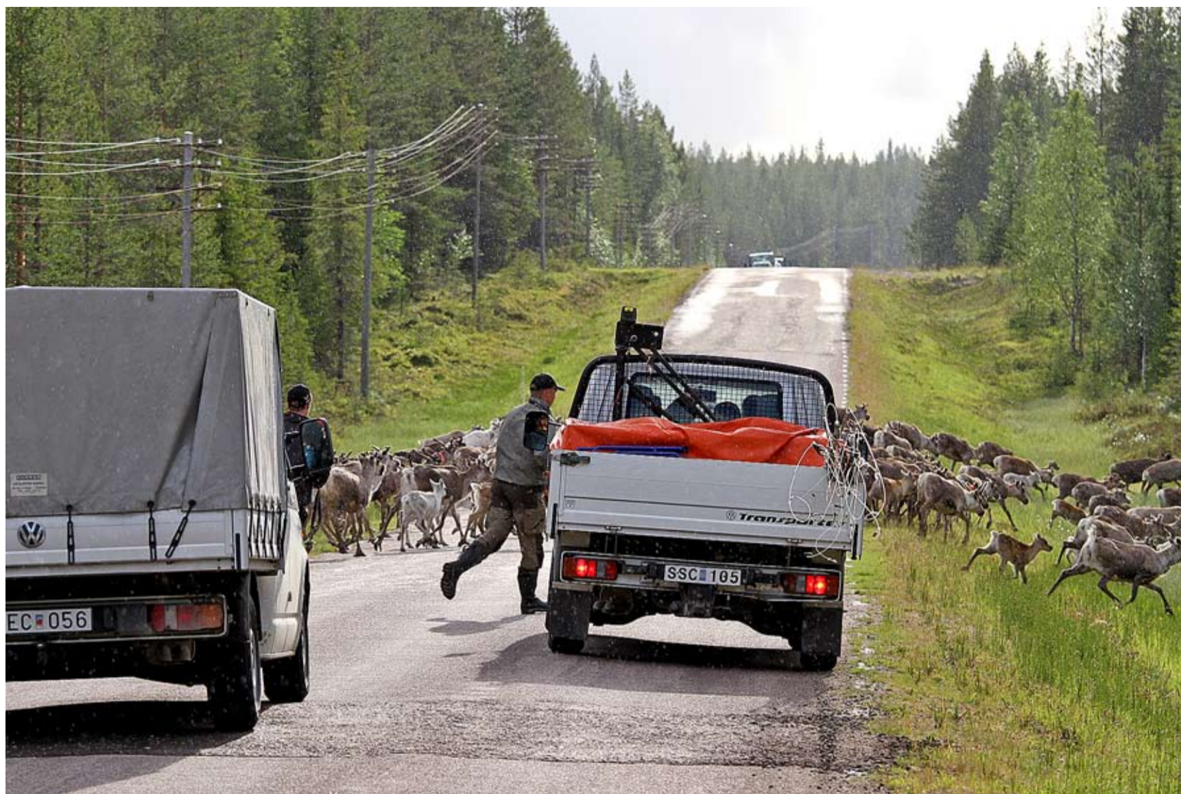
Det går undan när renarna korsar vägen och drivs in mot hagen med hjälp av helikopter och springande renskötare.