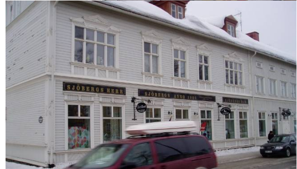
Väl anpassade planskyltar i färg och layout