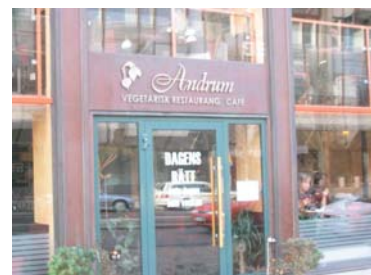
Färgen på bokstäverna är väl vald mot byggnadens bakgrund