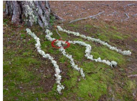
Landart med ungdomar 2004