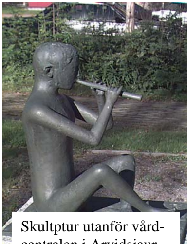
Skulptur utanför vårdcentralen i Arvidsjaur