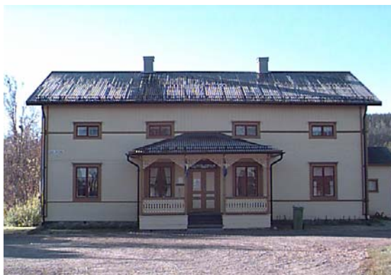
Gamla Prästgården Arvidsjaur