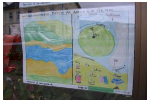
Sommarutställning i skyltfönster. Klass 5