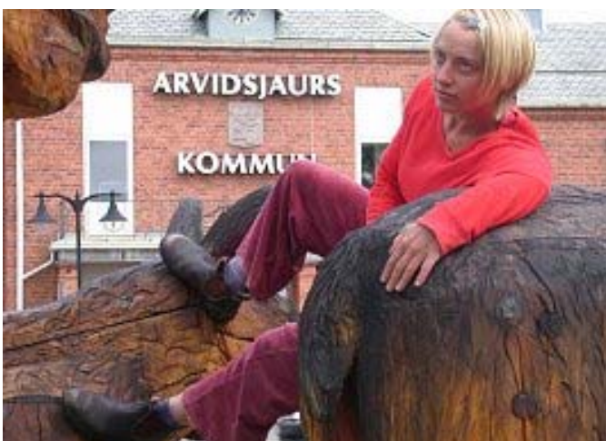
Dansare vid och på älgarna vid Medborgarhuset